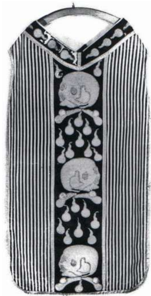
1. Ornat żałobny z kolumną zdobioną motywami czaszek i łez, XVIII w., rewers, zaginiony, Węgrów, kościół farny, fot. Jerzy Langda, Archiwum IS PAN.