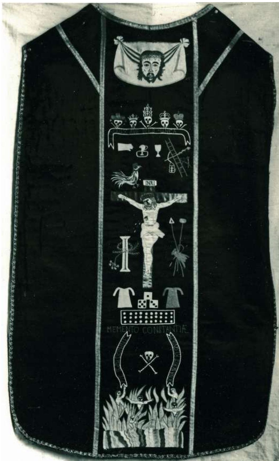
2. Ornat żałobny z przedstawieniem Ukrzyżowania wśród dusz czyścicowych i symbolami śmierci, rewers, zaginiony, XVIII w., Żeliszew, kościół parafialny, fot. Witalis Wolny, Archiwum IS PAN.