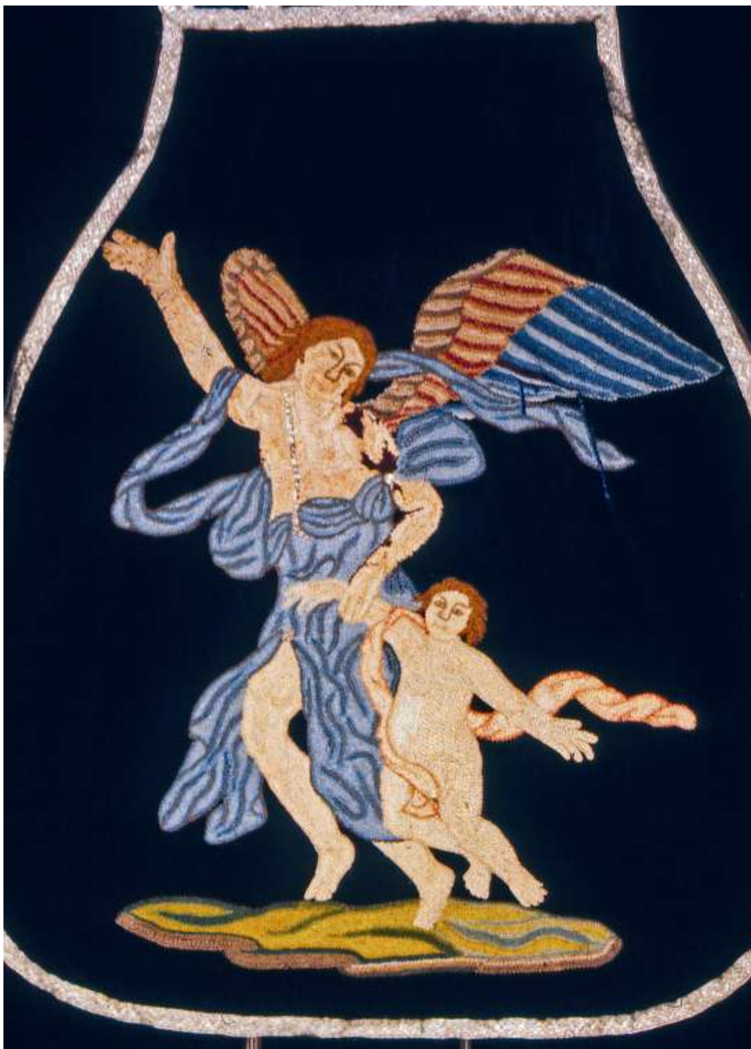
4. Ornat żałobny z przedstawieniem Anioła Stróża unoszącego duszę wybawioną z czyśćca, awers, XVIII w., Pełczyska, kościół parafialny, fot. Krystyna Moisan-Jabłońska.